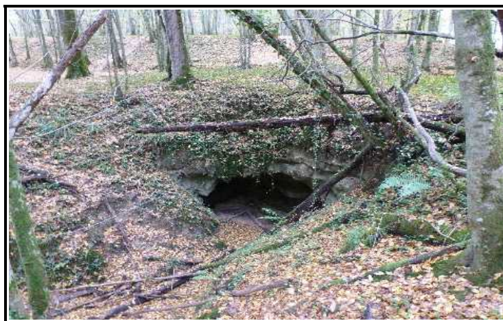
Figure 4 : accès au Trou de la Barrique

En parallèle, le relevé des autres propriétaires concernés par la grotte est en cours. Le but étant d'étudier la possibilité de placer une grille plus loin dans le boyau et non à l'entrée du Trou de la Barrique.