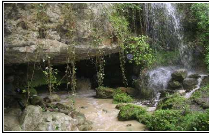
Figure 1 : accès du Trou Noir

Le contrat Natura 2000 a été déposé fin Novembre 2011. Les travaux débiteront en début d'année 2012. Un diagnostic écologique ( voir annexe 2 ) a été réalisé afin de cadrer les travaux de gestion. La mise en place du périmètre grillagé (complété d'un portail et d'une grille au niveau du ruisseau) et du panneau d'information y sont détaillés. La conception des deux panneaux d'information a été réalisée par l'animateur.