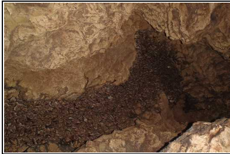
Figure 5 : colonie de mise-bas des Murins de grande taille

-10/06/2011 Temps frais, dans la grotte peu d'eau, mais trouble, suite orages. Dans le début du ruisseau 50 à 60 minioptères dispersés ou en essaim de moins de 15 individus. Un 1er essaim de 300 à 500 murins, environ 1/3 de juvéniles, dans une diaclase. Puis la nurserie de 3 à 4m 2 de murins de grande taille, avec quelques minioptères, dont des jeunes au stade "crevettes". A quelques mètres nurserie de minioptères ( crevettes ) avec quelques murins de grande taille, puis petite nurserie de minioptères avec toujours quelques murins de grande taille et à proximité un essaim de jeunes murins de grande taille. Les jeunes murins de grande taille sont nés entre le 10 mai et le 20 mai, ils se déplacent, d'ou le 1er essaim en aval; les minioptères ont moins de 5 jours. Au total 4 à 6000 murins, y compris les juvéniles ( un bon 1/3 du total ) et un millier de minioptères, sans compter les "crevettes"